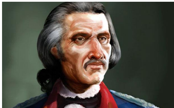
Imagem de Tiradentes produzida para o livro 1789, de Pedro Doria, feita a partir de depoimentos de época

Óleo de washt rodrigues/Museu histórico Nacional