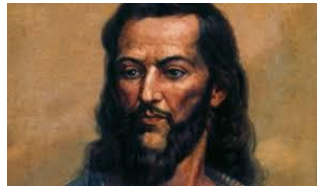
Pintura de Oscar Pereira da Silva traz o rosto idealizado de Tiradentes*

Óleo de washt rodrigues/Museu histórico Nacional