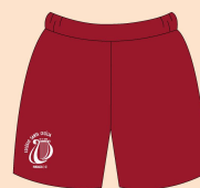
Calção Masculino Educação Física Tecido: Tactel 100% Poliamida