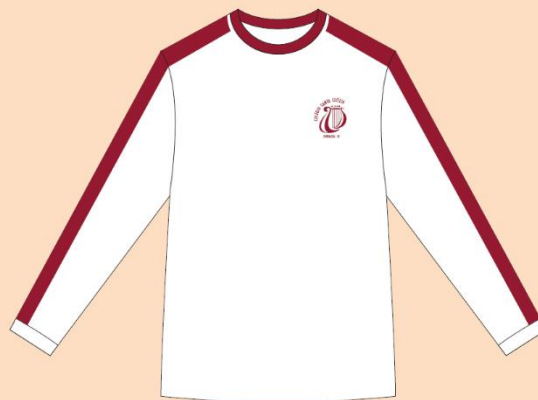
Camisa Manga Longa Tecido: 100% Algodão