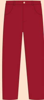
Calça Tecido Calça Feminina: Brim com Elastano. Tecido Calça Masculina: Brim.