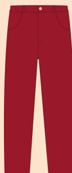
6º e 7º ano – Calça Tecido Calça Feminina: Brim com Elastano. Tecido Calça Masculina: Brim.