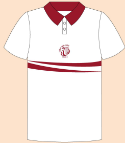
Camisa Polo sem Punho Tecido: Malha Piquet Branco

Obs.: O fardamento escolar deve ser usado com tênis na cor preta e meia branca.