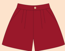
Bermuda Tecido: Tape 100% Algodão