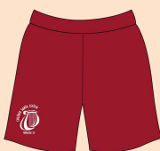
Short Feminino Educação Física Tecido: Helanca 100% Poliamida