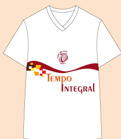
Camisa TISC Tecido: 100% Algodão

Obs.: O fardamento escolar deve ser usado com tênis na cor preta e meia branca.