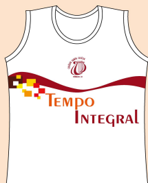
Camiseta TISC Tecido: 100% Algodão

Obs.: O fardamento escolar deve ser usado com uma papete na cor preta ou tênis na cor preta e meia branca.