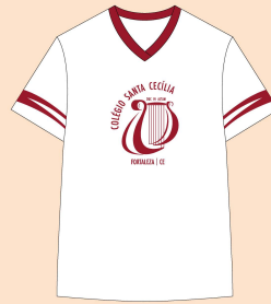
Camisa Educação Física Tecido: Malha Strong 100% Algodão