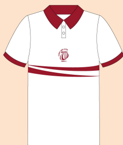
Camisa Polo com Punho Tecido: Malha Piquet Branco

Obs.: O fardamento escolar deve ser usado com tênis na cor preta e meia branca.