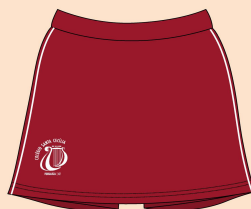
Short-saia Feminino Tecido: Malha Montaria 100% Poliamida