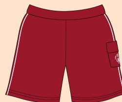
Calção Masculino Tecido: Malha Montaria 100% Poliamida