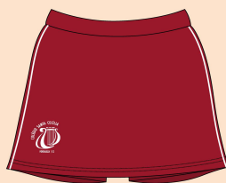
Short-saia Feminino Tecido: Malha Montaria 100% Poliamida