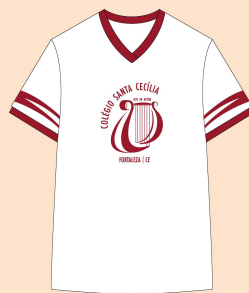
Camisa Educação Física Tecido: Malha Strong 100% Algodão