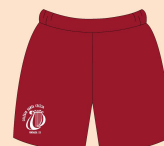
Calção Masculino Educação Física Tecido: Tactel 100% Poliamida