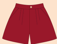
1º ao 5º ano – Bermuda Tecido: Tape 100% Algodão