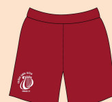
Short Feminino Educação Física Tecido: Helanca 100% Poliamida