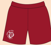
Short Feminino Educação Física Tecido: Helanca 100% Poliamida