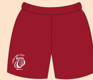
Calção Masculino Educação Física Tecido: Tactel 100% Poliamida