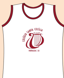
Camiseta Tecido: Malha Piquet Branco

Obs.: O fardamento escolar deve ser usado com uma papete na cor preta ou tênis na cor preta e meia branca.