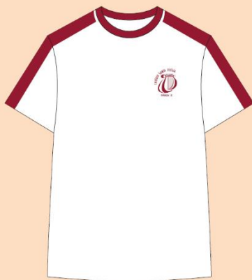
Camisa Manga Curta Tecido: 100% Algodão

Obs.: O fardamento escolar deve ser usado com tênis na cor preta e meia branca.